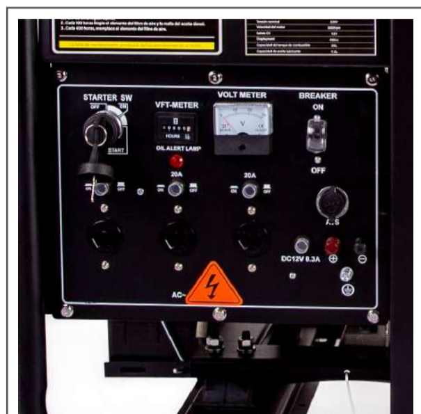
Tablero de conexión