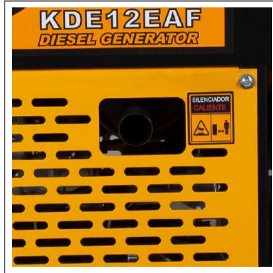
Salida de escape