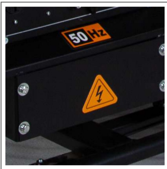
Bornera de conexión