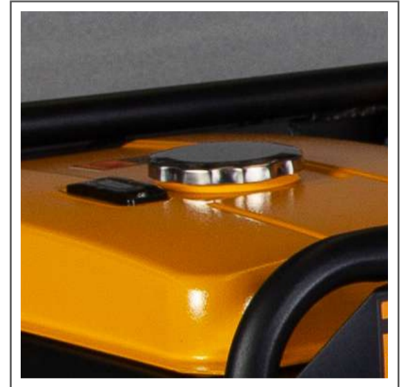
Medidor y tanque de combustible